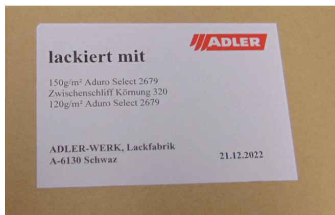
Abbildung 1: Muster 3.1 Etikette – Schichtaufbau