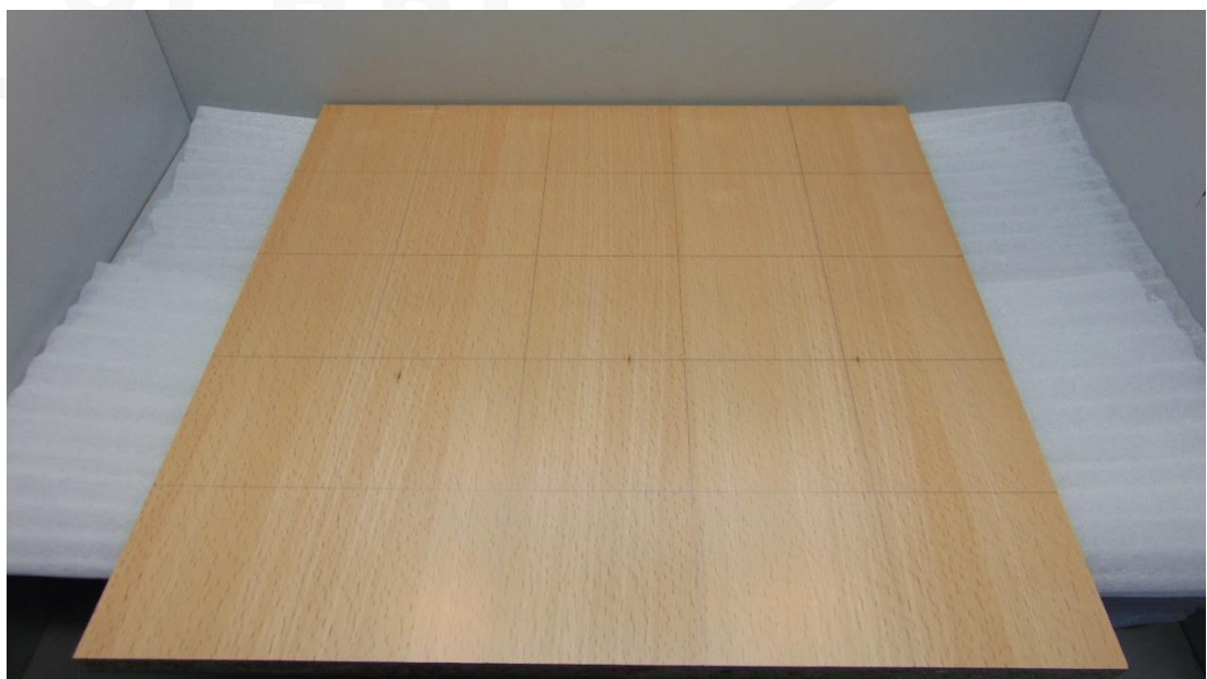
Abbildung 3: Muster 3.1 im Anlieferungszustand – Prüfseite Platte 1