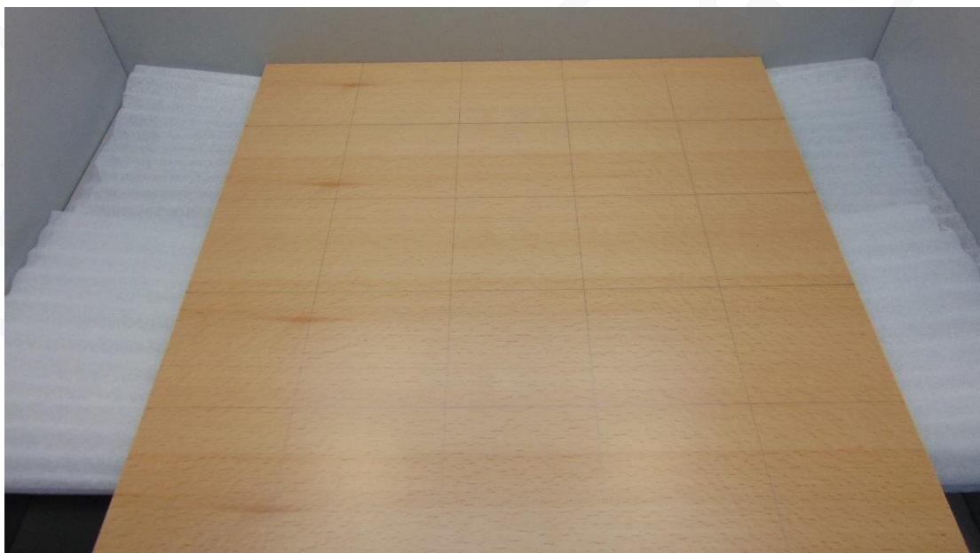
Abbildung 5: Muster 3.1 im Anlieferungszustand – Prüfseite Platte 2