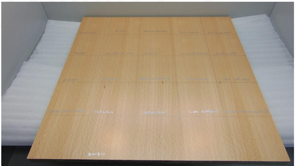
Abbildung 7: Muster 3.1 nach Belastung – Prüfseite Platte 2