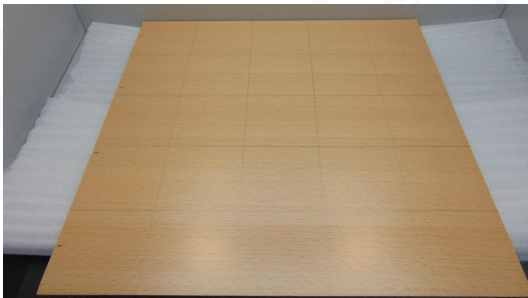
Abbildung 5: Muster 3.1 im Anlieferungszustand – Prüfseite Platte 2