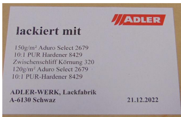
Abbildung 1: Muster 3.1 im Anlieferungszustand – Beschichtung