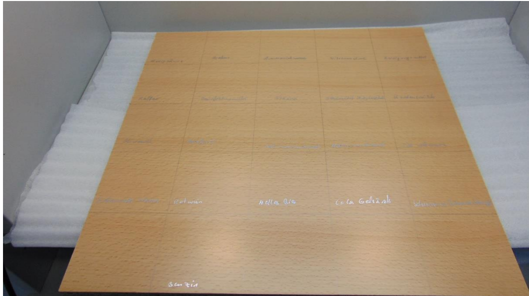
Abbildung 6: Muster 3.1 nach Belastung – Prüfseite Platte 1

Nachfolgende Bilder dokumentieren das erhaltene Ergebnis an den beiden geprüften Musterplatten nach der Auswertung: