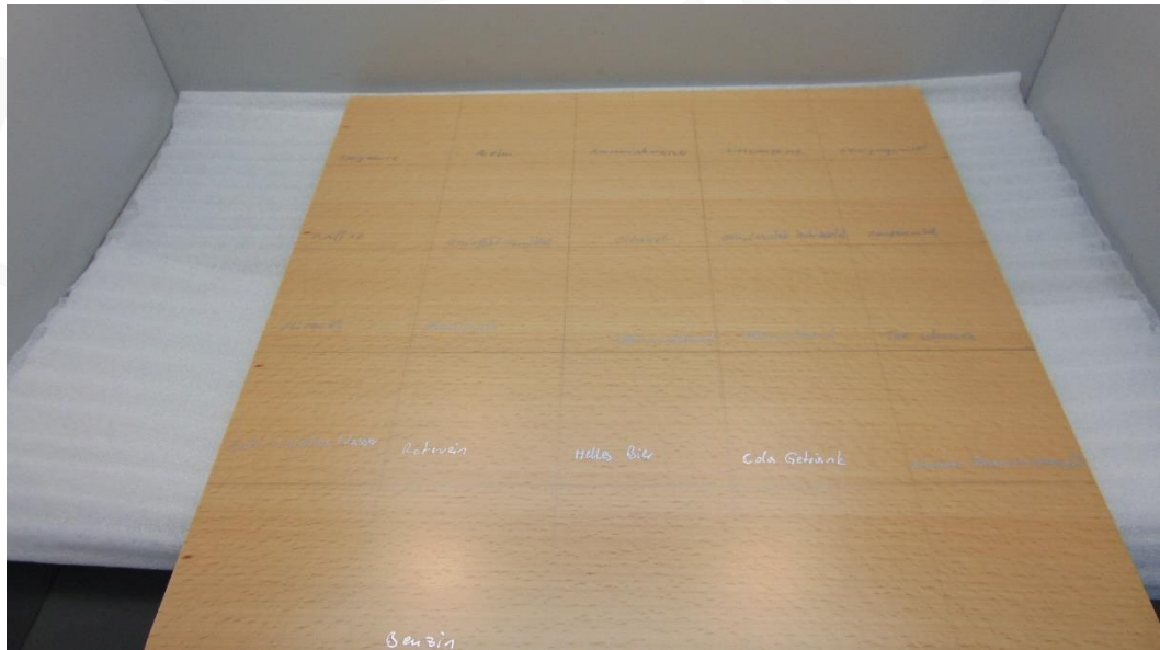
Abbildung 7: Muster 3.1 nach Belastung – Prüfseite Platte 2