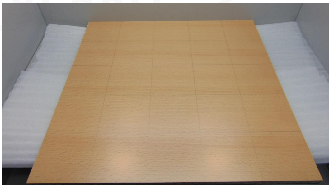
Abbildung 3: Muster 3.1 im Anlieferungszustand – Prüfseite Platte 1