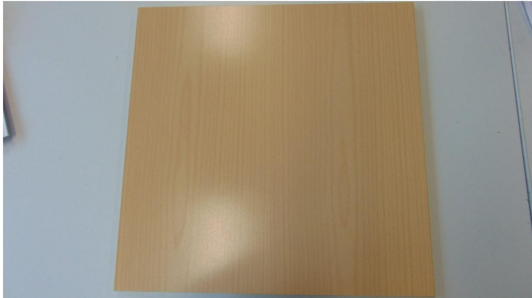
Abbildung 3: Muster 3.1 im Anlieferungszustand – Prüfseite Platte 2