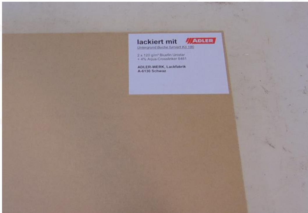
Abbildung 4: Muster 3.2 im Anlieferungszustand – Rückseite