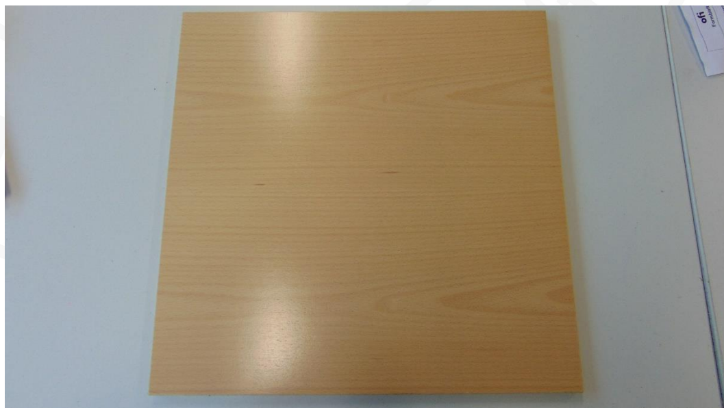
Abbildung 2: Muster 3.1 im Anlieferungszustand – Prüfseite Platte 1