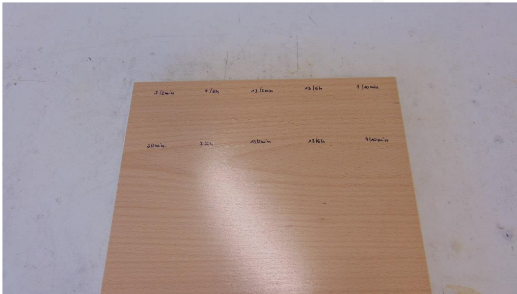
Abbildung 7: Muster 3.2 nach Wiederholung der Belastung – Prüfseite