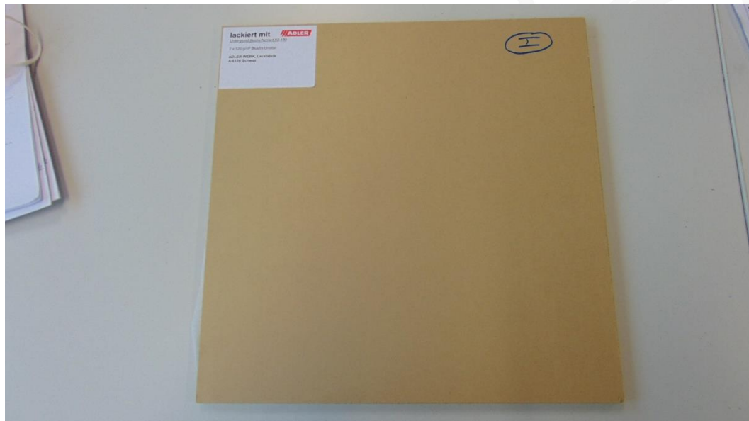
Abbildung 1: Muster 3.1 im Anlieferungszustand – Rückseite Platte 1

Nachfolgende Bilder dokumentieren die Muster im Anlieferungszustand: